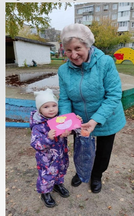
День пожилого человека