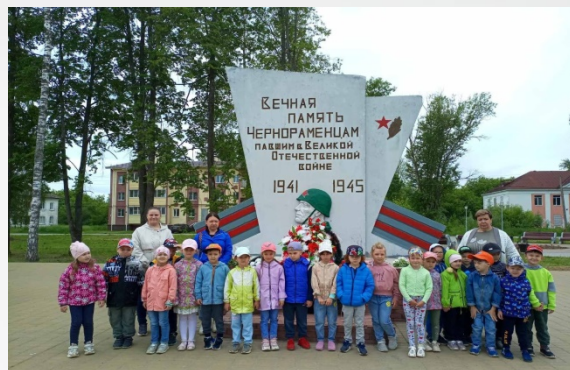
Экскурсия «День победы»