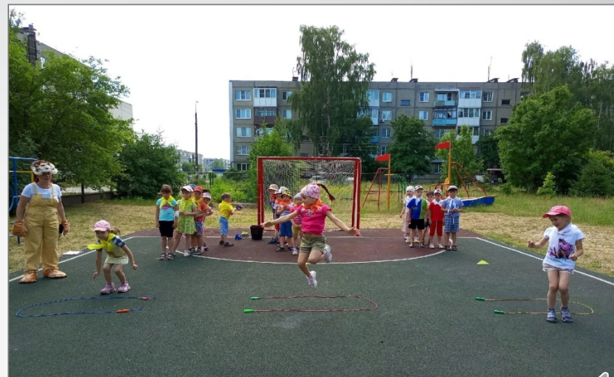
Международный день тигра «Длинный хвост, большие лапы»