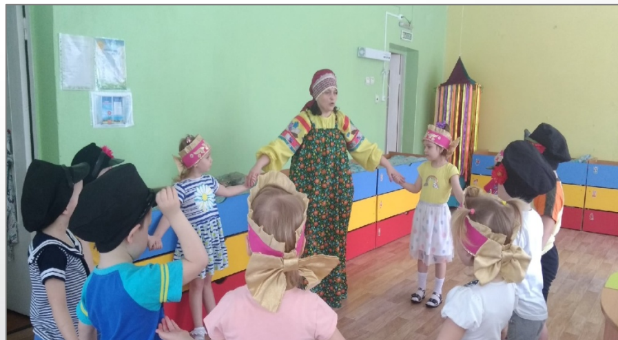
«В гостях у Марьюшки»