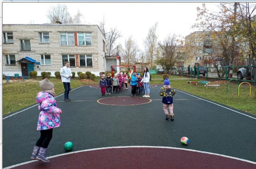
Досуг «Музыкальная шкатулка»