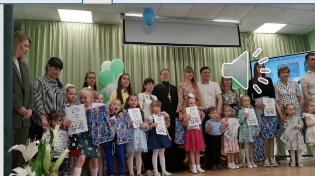
Конкурс «Мамочка-мой ангел»