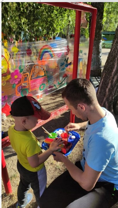
Мастер-класс по нетрадиционному рисованию