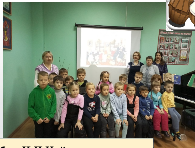
«Детский альбом И.П.Чайковского»