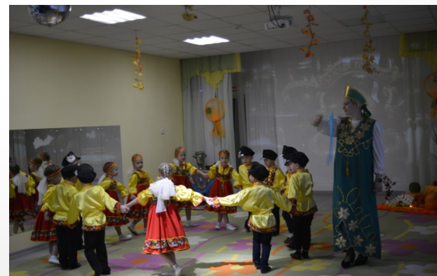
Праздник «Путешествие по Нижегородскому краю»