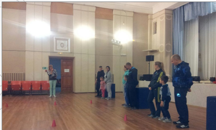
«Папа, мама, я – спортивная семья»